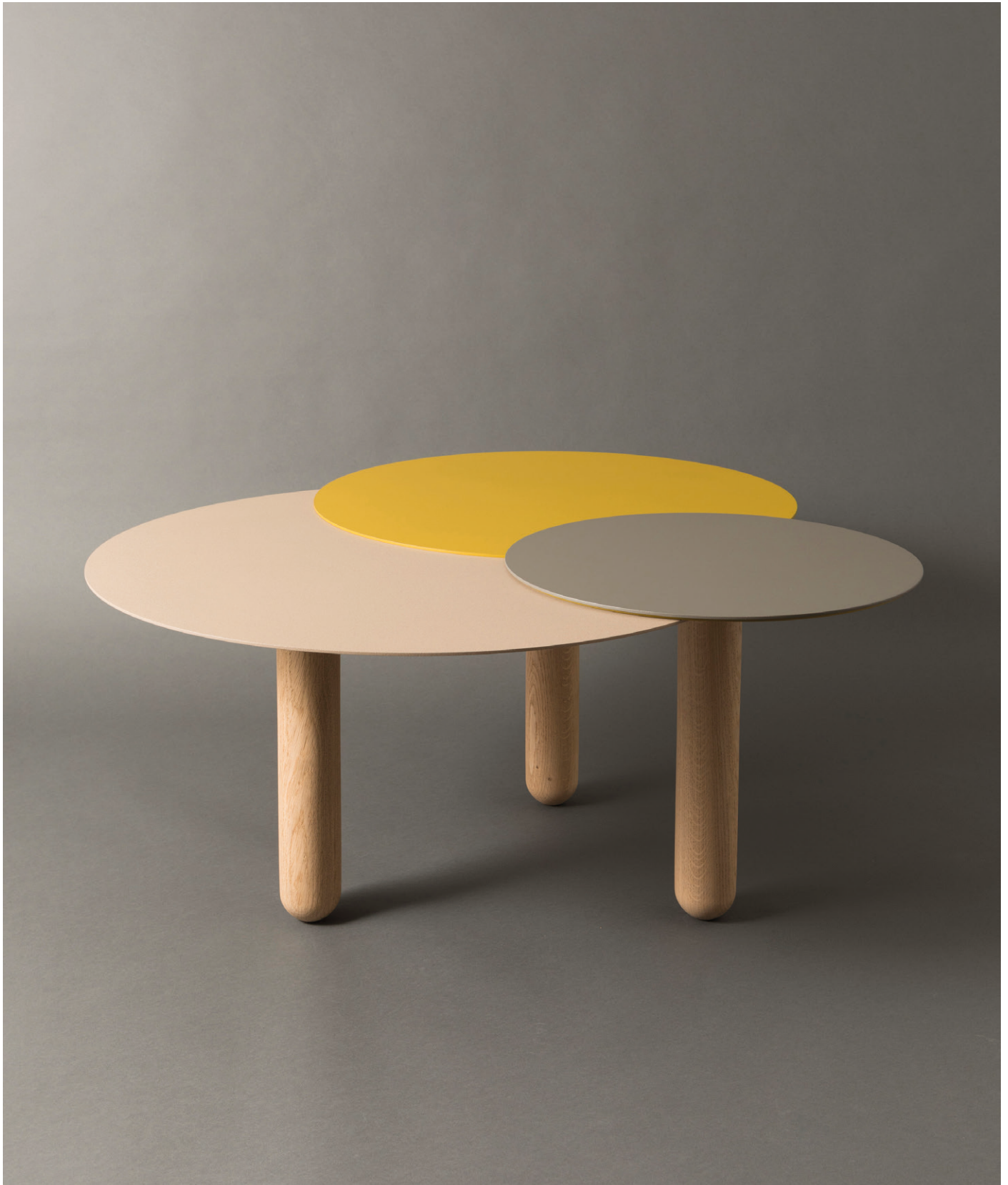
Table basse | Low table